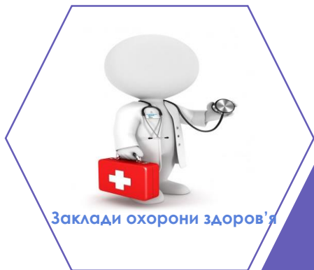
Заклади охорони здоров'я

соціальні послуги відповідно до індивідуального плану соціального захисту дитини